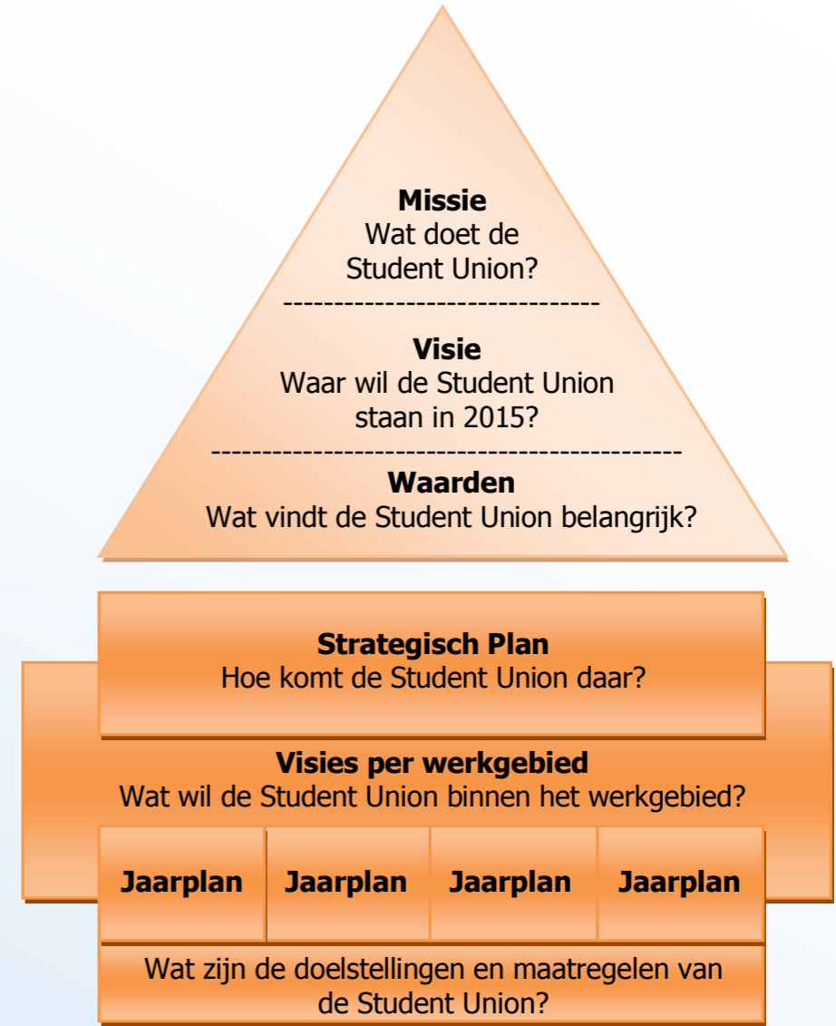
Figuur 1: Opbouw Strategisch Plan ten opzichte van Jaarplannen